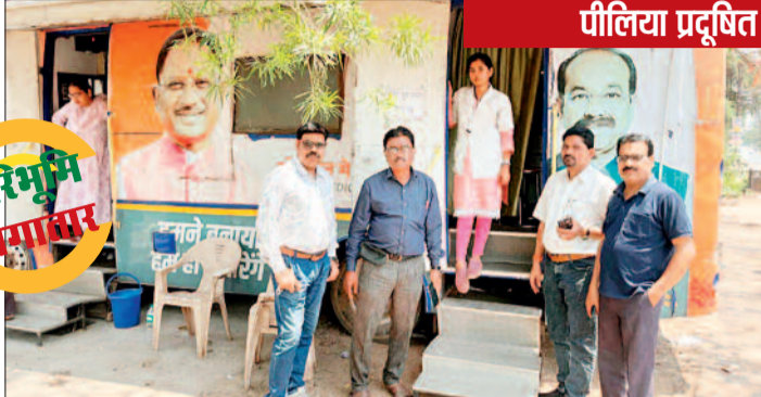
पीलिया प्रदूषित जल और भोजन के माध्यम से फैलने वाला संक्रामक रोग