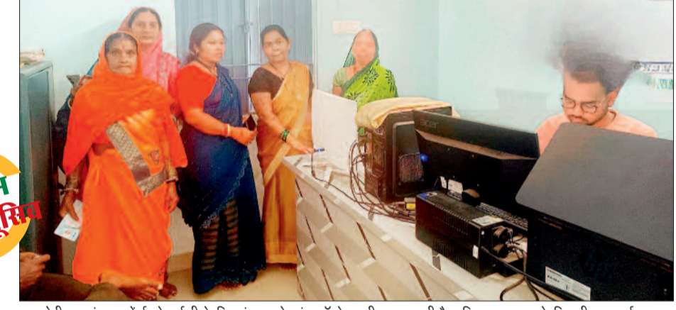
उमरपोटी ग्राम पंचायत में ई-केवाईसी के लिए पंचायत में स्वयं ऑपरेटर की व्यवस्था की है। रिविwar अवकाश के दिन भी यह कार्य हुआ।

दुर्ग जिले में महतारी वंदन योजना के हितग्राहियों की ई-केवाईसी करवाई जा रही है। महिला एवं बाल विकास विभाग द्वारा ई-केवाईसी शहरी क्षेत्र में वार्डों व आंगनबाड़ी केंद्रों में और ग्रामीण क्षेत्रों में पंचायतों में करवाना है। जिले में 4 लाख 296 हितग्राहियों की ई-केवाईसी होना है लेकिन हाल-बेहाल है। ई-केवाईसी करने के लिए न वार्डों में और न ही आंगनबाड़ी केंद्रों में कंप्यूटर ऑपरेटरों की व्यवस्था की गई है। जिसकी वजह से इस भीषण गर्मी में हितग्राहियों को चक्कर काटने पड़ रहे हैं। जहां ऑपरेटर की व्यवस्था है वहां इतनी भीड़ है कि ई-केवाईसी करवाने के लिए सुबह से शाम तक मशक्कत करनी पड़ रही है।